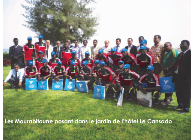
Les Mourabitounes posant dans le jardin de l'hôtel Le Cansado

Le 21 juillet 2013 à Nouakchott, l'Equipe Nationale, les Mourabitounes, a battu en retour les Sénégalais sur un score de 2 buts à Zéro, arrachant ainsi une qualification historique à une phase finale d'une compétition continentale.