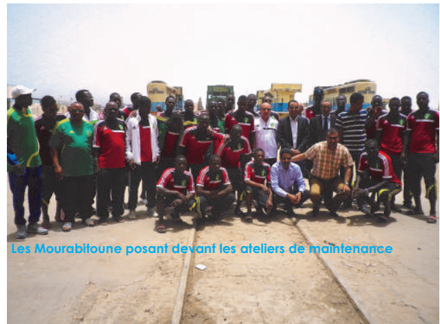
Les Mourabitounes posant devant les ateliers de maintenance