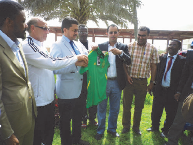
L'ADG de la SNIM recevant un maillot de l'équipe nationale des mains du président de la FFRIM